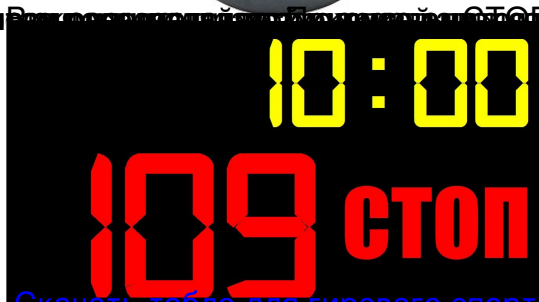
Скачать табло для гиревого спорта 1.0

Временная панель для гиревого спорта (буферизация).